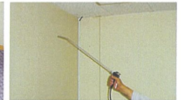
天井や壁などに付いたニオイに、消臭抗菌液を噴霧します。