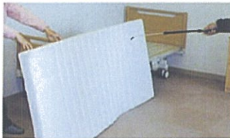
気付きにくいベッドやマットレスに染み付いたニオイに消臭抗菌液を噴霧します。

ラット試験結果:急性経毒性 LD50>2,000mg/kg(食塩と同じレベル) 環境影響情報:魚毒性・蓄積性共になし(生分解性のため対象外)