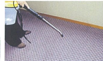
ジュウタンなど特にニオイが染み付きやすいため入念に消臭抗菌液を噴霧します。