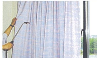
カーテンなどに染み付いたニオイに、消臭抗菌液を噴霧します。