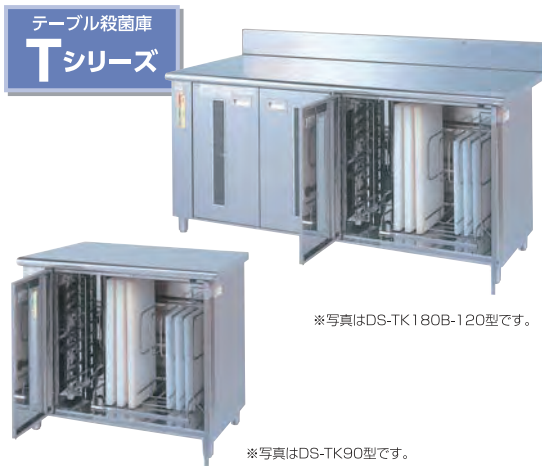
テーブル殺菌庫 型式一覧表 <全共通>包丁最大寸法:刃360mm、柄160mm/まな板最大寸法:610×410×43mm