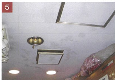
5 天井面に付いた「ラット・デオ」が乾いたら施工完了。