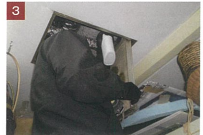
3 「ラット・デオ」を天井裏全体に噴霧。 噴霧器とハンドスプレーを使用。 (天井裏では配線等確認の上、吹き付け施工を実施)