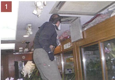
1 天井裏から異臭確認。

●施工場所：某店舗 ●施工内容：店舗バックヤードの天井裏からの獣臭(糞尿臭)対策 ●使用剤：「ラット・デオ」1200ml(600ml 2本使用) ●現場面積：約20㎡