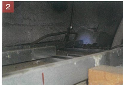
2 天井裏に糞尿形跡確認・除去。 (強烈なニオイあり)