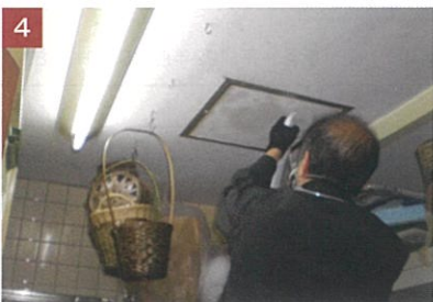
4 天井面全体とクロス壁にハンドスプレーを使用して吹き付け。