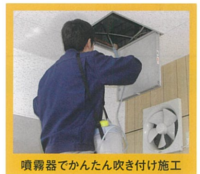
噴霧器でかんたん吹き付け施工