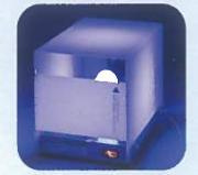
点灯イメージです。

希望小売価格 28,000 捕虫ランプ 虫くるランプ 6W (LDTM6BLB) 捕虫シート UC-30S 本体寸法 W153 / D226 / H193 有効面積 40 ~ 50 m 2 定格 AC 100V 本体重量 1.3kg 電源コード 約 1.7m カバー材質 アクリル